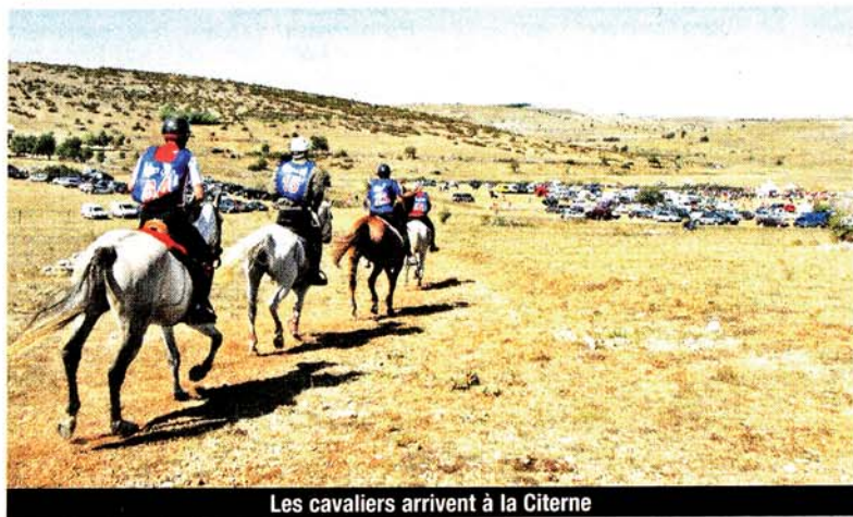
Les cavaliers arrivent à la Citerne

Le travail de lobbying a été intense auprès des différentes fédérations ? « Il a fallu convaincre d'abord la Fédération française d'équitation (FFE) à travers un dossier financier solide sachant qu'il faut un budget de 500 000 €. Grâce au soutien d'Alain Bertrand, le Conseil régional s'est engagé à apporter 200 000 €. Le Conseil général a répondu présent à travers