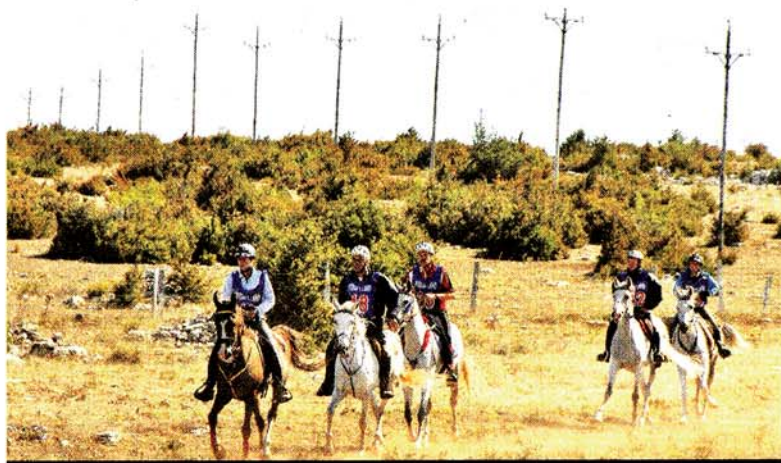
Pas de goudron pour les 160 km de Florac mais les pistes du Causse

Les championnats d'Europe et du Monde sont organisés à tour de rôle. En 2009, les Europe ont eu lieu à Assise en Italie où malgré d'énormes investissements, les chevaux ont eu droit à 50 km de goudron ce qui a valu des critiques à la FEI. Les Monde se dérouleront le 25 septembre 2010 aux USA dans le Kentucky.